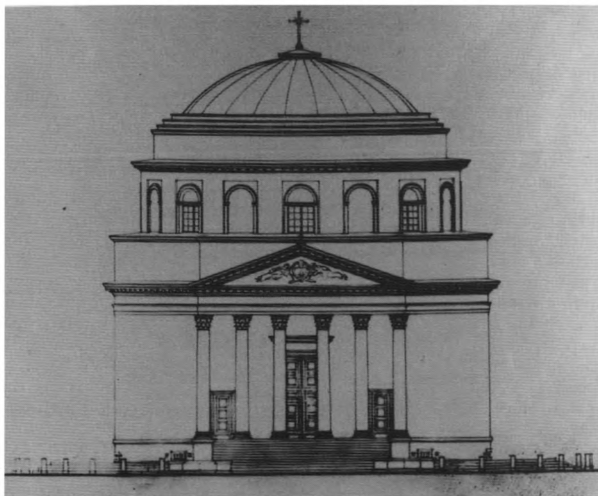
3. Projekt odbudowy kościoła p. w. św. Aleksandra – elewacja frontowa, 1945r.

sultant w budowie i przebudowie mostów: Łazienkowskiego, Starzyńskiego, Poniatowskiego.