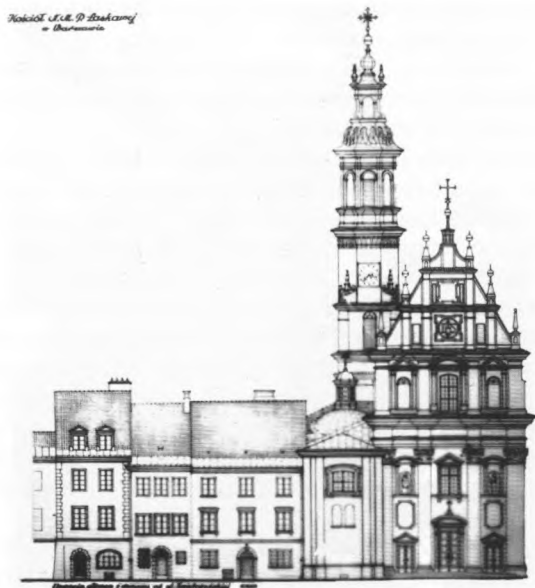
2. Projekt odbudowy kościoła p. w. Matki Bożej Łaskawej – elewacja frontowa, 1947r.

W czasie okupacji, dzięki wcześniejszym dobrym kontaktom z duchowieństwem, bywał zatrudniany przy remontach kościołów i klasztorów, które bardzo ucierpiały wskutek bombardowań. Odbudowywał obiekty ss. Szarytek na Powiślu i oo. Pallotyńów na Pradze, uczestniczył w zabezpieczaniu prowizorycznymi dachami wielu zniszczonych świątyń. Wobec likwidacji przez okupanta wyższych uczelni włączył się wraz z kolegami z Politechniki w tajne nauczanie. Od początku wojny przystąpił do podziemnej organizacji zbrojnej ZWZ-AK. Podczas powstania warszawskiego walczył jako żołnierz VI Obwodu AK na Pradze. Przebywając na terenie starej rzeźni przy ul. Jagiellońskiej, widział jak na drugim brzegu Wisły ginęły zabytki Warszawy.