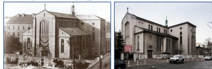
Kościół p.w. św. Klemensa Dworzaka na ul. Karolkowej. Widok przed wojną i obecnie.