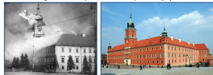
Zamek Królewski płonący 17 września 1939 r. i widok współczesny.

Działając zgodnie z wolą prezydenta Warszawy Stefana Starzyńskiego, podjął się profesjonalnej oceny stanu zniszczeń substancji miejskiej spowodowanych działaniami wojennymi. W czasie okupacji, dzięki wcześniejszym dobrym kontaktom z duchowieństwem, był zatrudniany przy remontach kościołów i klasztorów, które bardzo ucierpiały wskutek bombardowań. Odbudowywał obiekty sióstr Szarytek na Powiślu i ojców Pallotynów na Pradze. Uczestniczył w zabezpieczaniu prowizorycznymi dachami wielu zniszczonych świątyń. Wobec likwidacji przez okupanta wyższych uczelni włączył się wraz z kolegami z Politechniki w tajne nauczanie. Od początku wojny przystąpił do podziemnej organizacji zbrojnej Związek Walki Zbrojnej – Armia Krajowa.